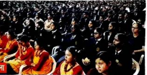
डॉ. मुंजे व्याख्यानमाला