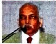
प्रतिनिधी | नाशिक

कॉम्प्रेहेन्सिव्ह नॅशनल सिक्युरिटी अँड आत्मनिर्भरता विषयावर संवाद