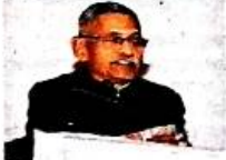
प्रतिनिधी • नाशिक

चीनचे भारत आणि भूतान वगळता इतर देशांशी सामंजस्याचे धोरण